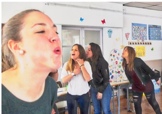
Treball pràctic al mòdul 5: Expressió i comunicació