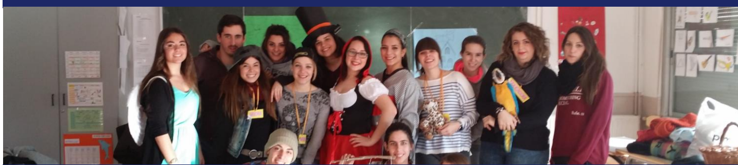
Activitat: pràctica de llenguatge no verbal