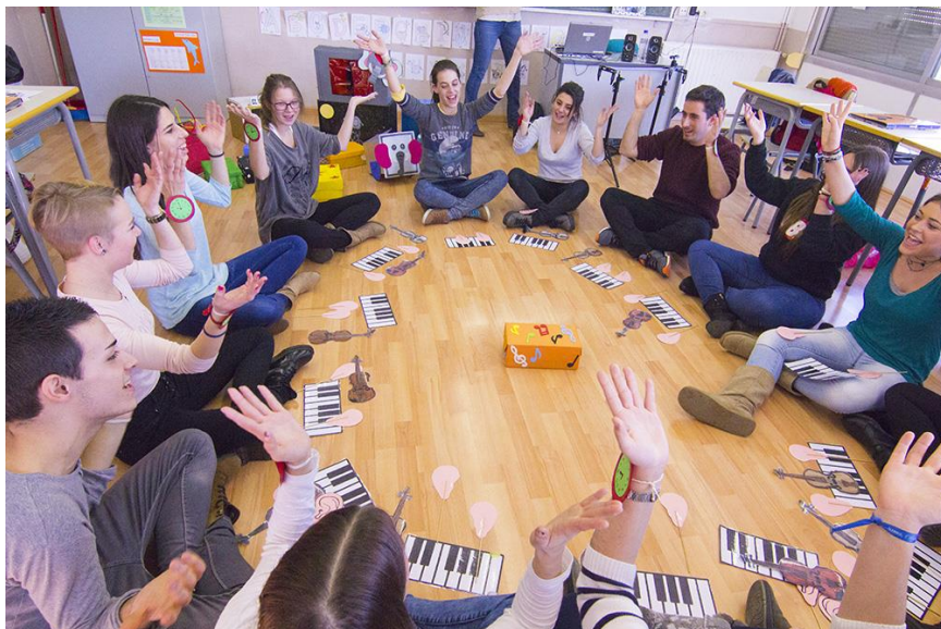
Activitat a l'aula amb col·laboradors professionals externs