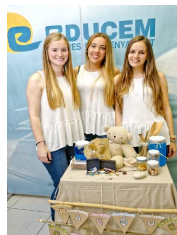
Presentació dels Projectes Finals de Cicle 2015 – 16: Premi a l'excel·lència a l'originalitat del projecte