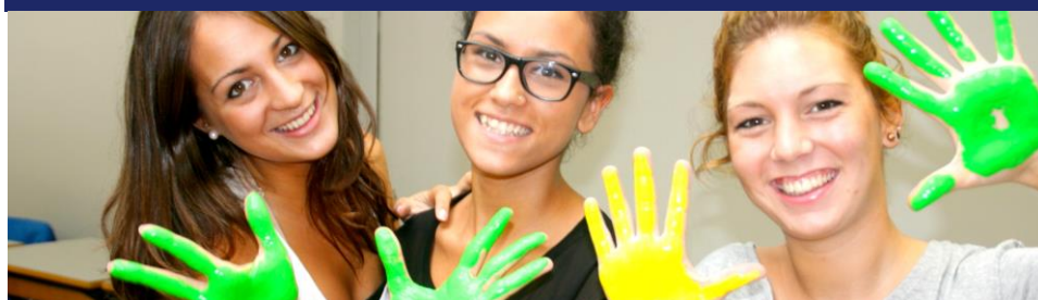
Activitat: Decoració per al dia de la Castanyada (*)