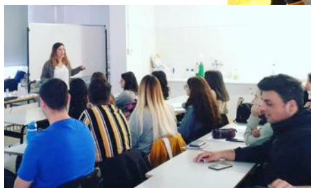
Xerrada dels Laboratoris Avène