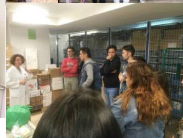
Visita a l'Hospital de Granollers