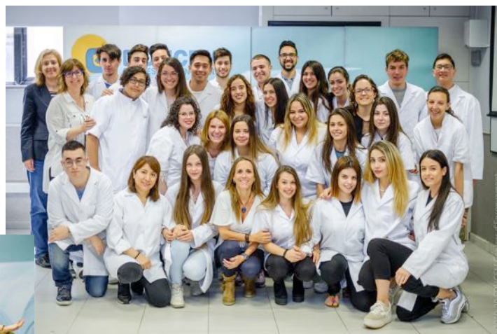
Presentació del Crèdit de Síntesi Final de Curs de la promoció 2018-19