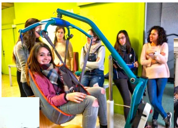
Visita al centre Sirius