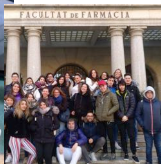
Visita a la planta pilot de la Facultat de Farmàcia