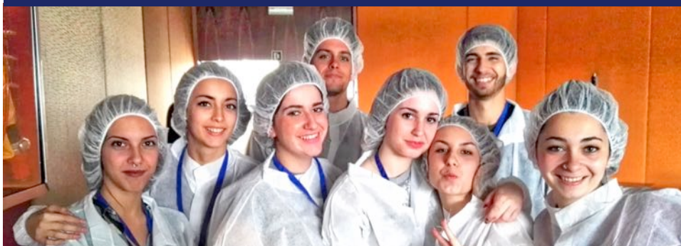
El cicle inclou sortides a empreses i institucions de l'àmbit de la Salut (*)