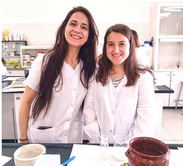
Laboratori: preparació de xampú anticaspa.