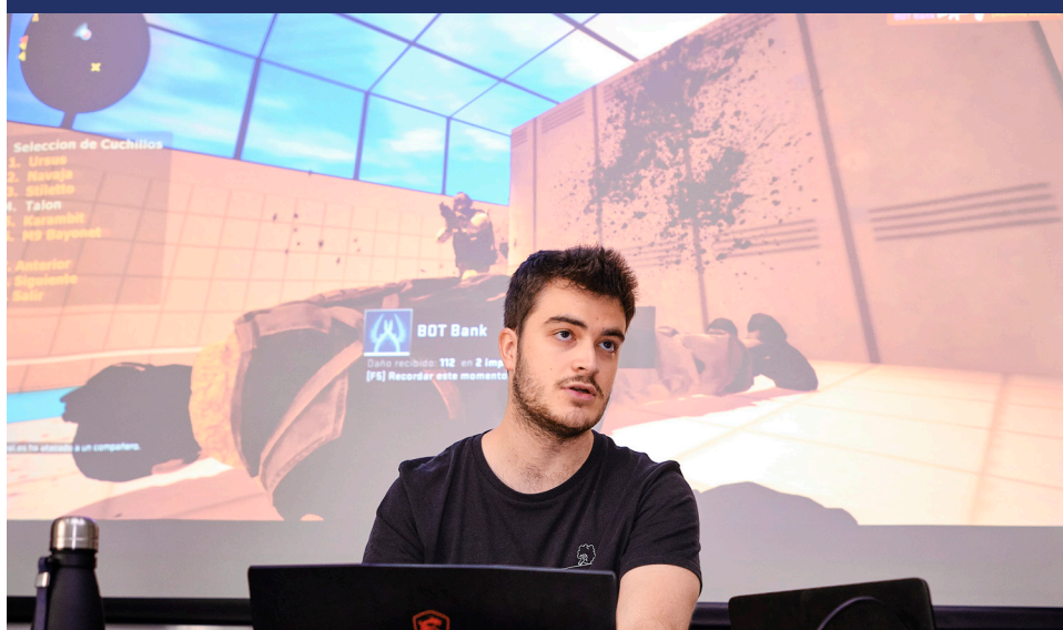
Presentació del Projecte Final de Cicle Blandotech: plataforma de hosting de servidors de videojocs, específicament Minecraft i CS GO. (*)