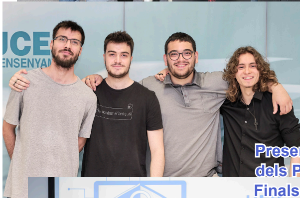
Presentacions dels Projectes Finals de Cicle 2021 - 22