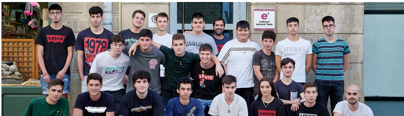
Promoció del Cicle Formatiu Administració de Sistemes Informàtics en Xarxa 2021 - 23