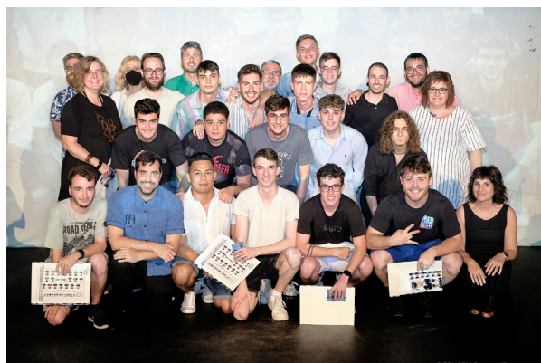
Acte de cloenda i lliurament de premis del CFGS Educació Infantil promoció 2020 – 22