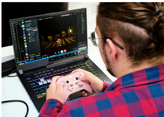
Projecte Pixy, Solució de programació a baix nivell i enginyeria inversa orientada al hacking de videojocs.